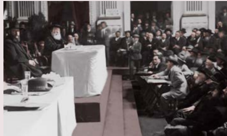
הג"ד אהרן לעווין זצ"ל נואם בהכנסת הגדולה תרפ"ט

ו אם לא יועיל לא יזיק. המקור היותר קדום שמצאתי הוא בדרשות הר"ן (הדרש הששי). גם נמצא במהר"י בן לב (חלק ד סימן כה), בהקדמת מחיר יין לרמ"א, ובעץ חיים (שער לז פרק ב).